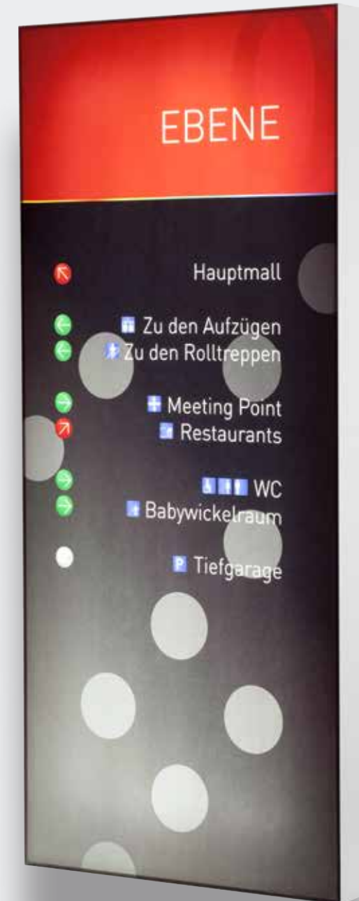
Textilspanrahmen mit oder ohne Beleuchtung